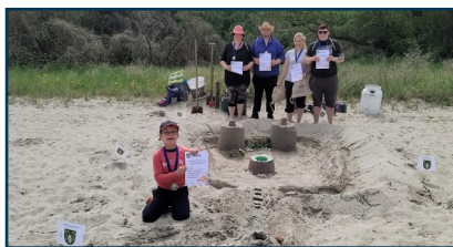
Siegerteam 2024 Wohlenberg

Anmeldung der Buddelteams unter 038825-267240 oder stadtinfo@kluetz-mv.de - und (sofern noch Plätze verfügbar sind) am Veranstaltungstag am Strand.