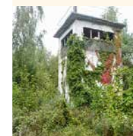
Führungsstelle der DDR-Grenztruppen bei Pötenitz