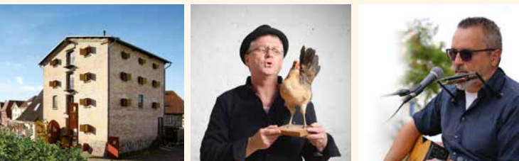
Literaturhaus „Uwe Johnson“ © Silke Winkler; Hagen Möckel © Karin Böhme; Tobi Beck © privat