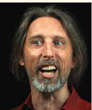
Rainer Rudloff © Eckehart Lepenies